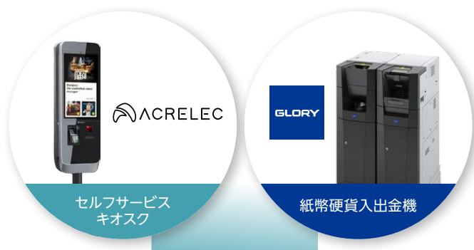
セルフサービス キオスク

※ 注文や代金精算等を利用者自身で行う情報端末。業務省力化へ貢献するとともに、販売データを活用する新たなビジネスをサポートする機器として注目されています。