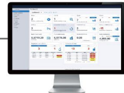
現金管理ソフトウェア 「CI-SERVERX」