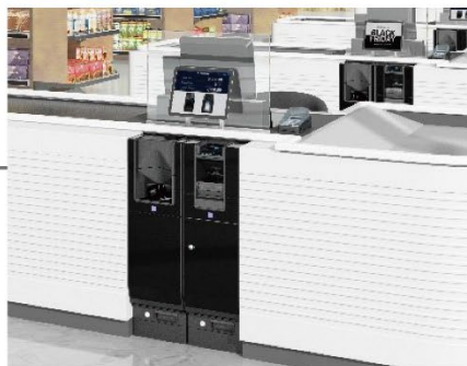
フロント向け紙幣硬貨入出金システム CI-10X