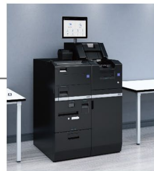
バックオフィス向け紙幣硬貨入出金システム CI-100X/300X/500X

※ Red Dot のロゴは Red Dot GmbH & Co. KG の商標です。