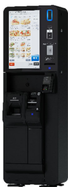
セルフオーダー-KIOSK「FGK-100シリーズ」