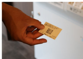
券売機で購入後、 QRコード付きチケットを発券