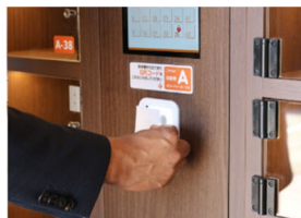
QRコードをロッカーの 読み取り部にかざす