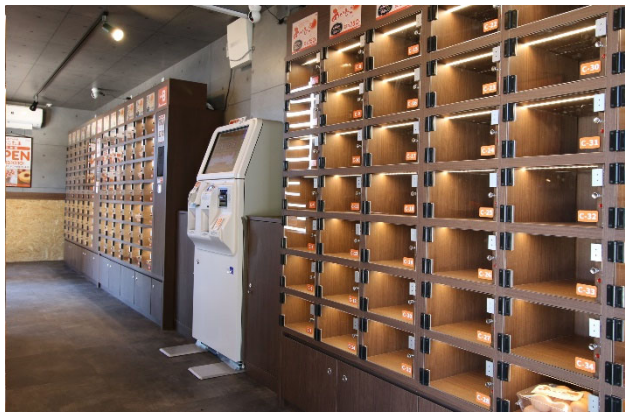
店内は完全無人で、券売機とロッカーのみ

近年、人手不足の解消や人件費削減を目的に、多くの小売業が新たな選択肢として無人での店舗運営を検討しています。