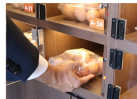
該当商品が入っているロッカーのラン プが点灯。商品を取り出す