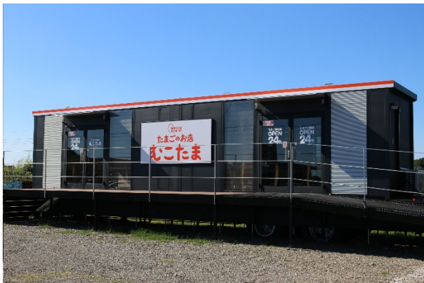
24時間営業のトレーラーハウス型の店舗 たまごのお店「むこたま 白井店」