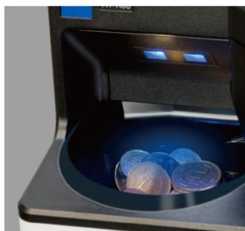
▲入出金口にガイドランプを搭載

さらに、現金のリジェクト時やトラブルがあった場合は出金口が赤く点灯し、お知らせします。