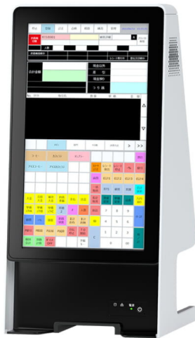
▲スタッフ操作画面