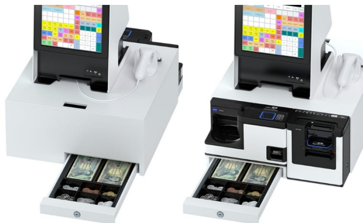
▲セミセルフ運用時

ドロワーは、引き出し方向が選択できるため、つり銭機をお客さま側に向けるセミセルフ運用、つり銭機をスタッフ側に向ける有人運用のどちらでも利用ができます。