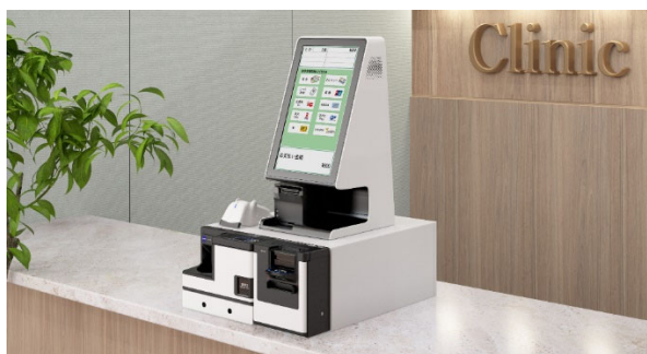
▲お客さまが現金授受を行う「セミセルフ運用」