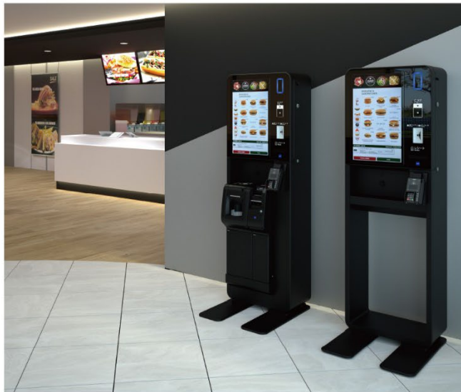
店舗設置イメージ