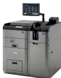
バックオフィス向け (CI-100)