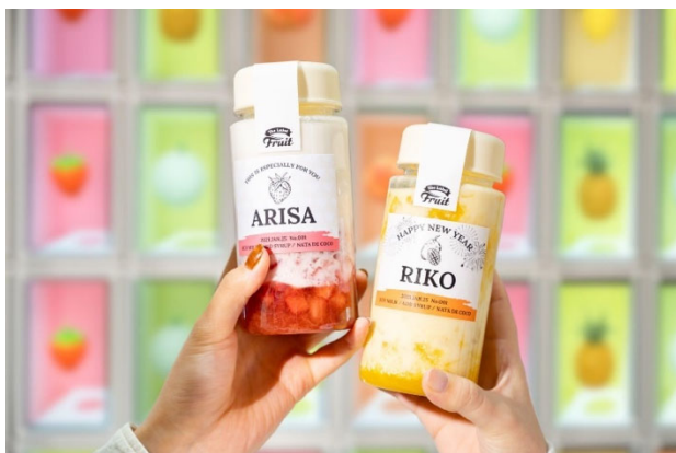
《味とラベルをカスタマイズできるフルーツオレのイメージ》

グローリー株式会社（兵庫県姫路市）は、12月2日にリリース（ お知らせ ）いたしました通り、株式会社 Showcase Gig（東京都港区）と共同で、2021年12月15日（水）より、東京・原宿で次世代フルーツオレ専門店「The Label Fruit（以下 ラベルフルーツ）」をオープンします。併せてオープン日より期間限定でクリスマスなどをイメージした HAPPY HOLIDAY ラベルもチョイスできます。ラベルデザインの選択肢が増え、自分だけにカスタマイズされたラベルのフルーツオレが楽しめます。