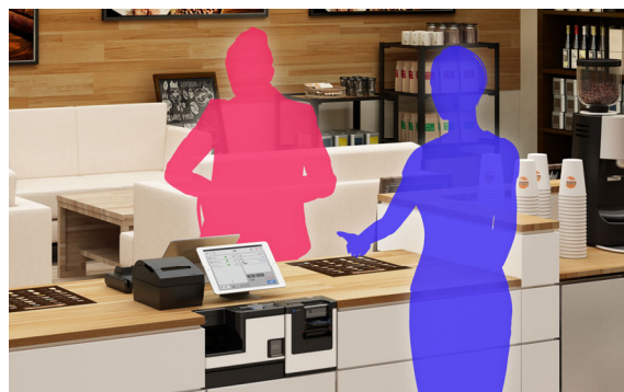
店員が現金授受を行う「有人運用」