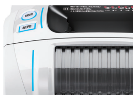
▲操作部ランプ表示