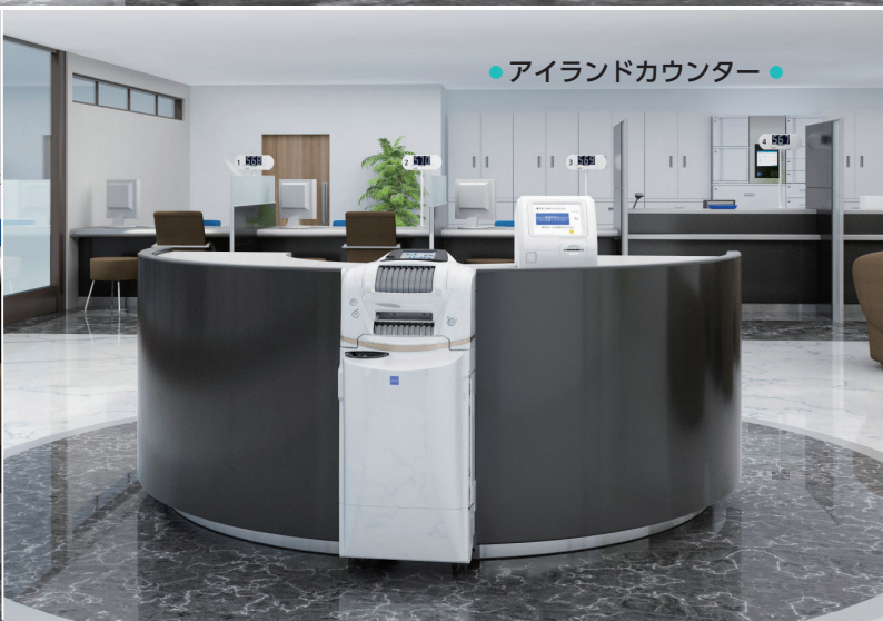
● アイランドカウンター ●