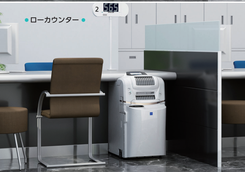
● ローカウンター ●