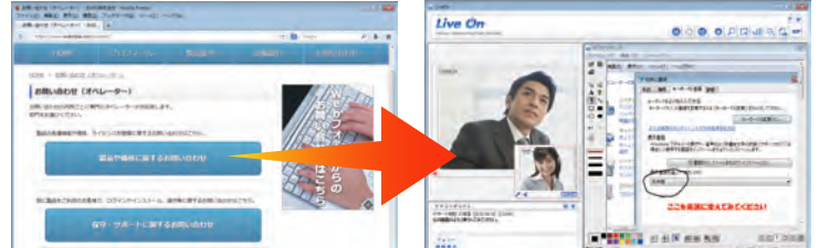
Webサイトなど呼び出し用URLを埋め込み